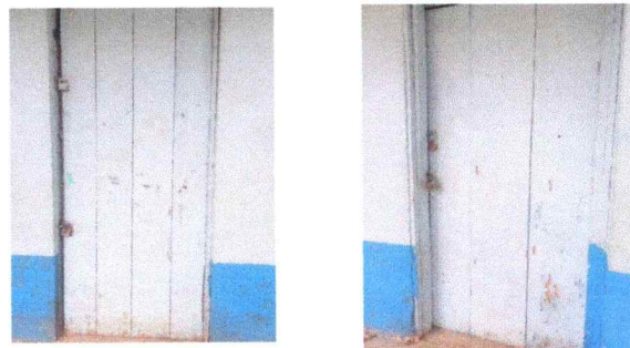
Foto 4: Cambio de Puertas, Aula 3 y lugar de alimentación escolar.