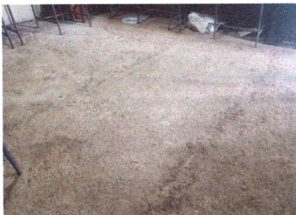
Foto1: Colocación de piso cerámico al lugar de alimentación escolar.